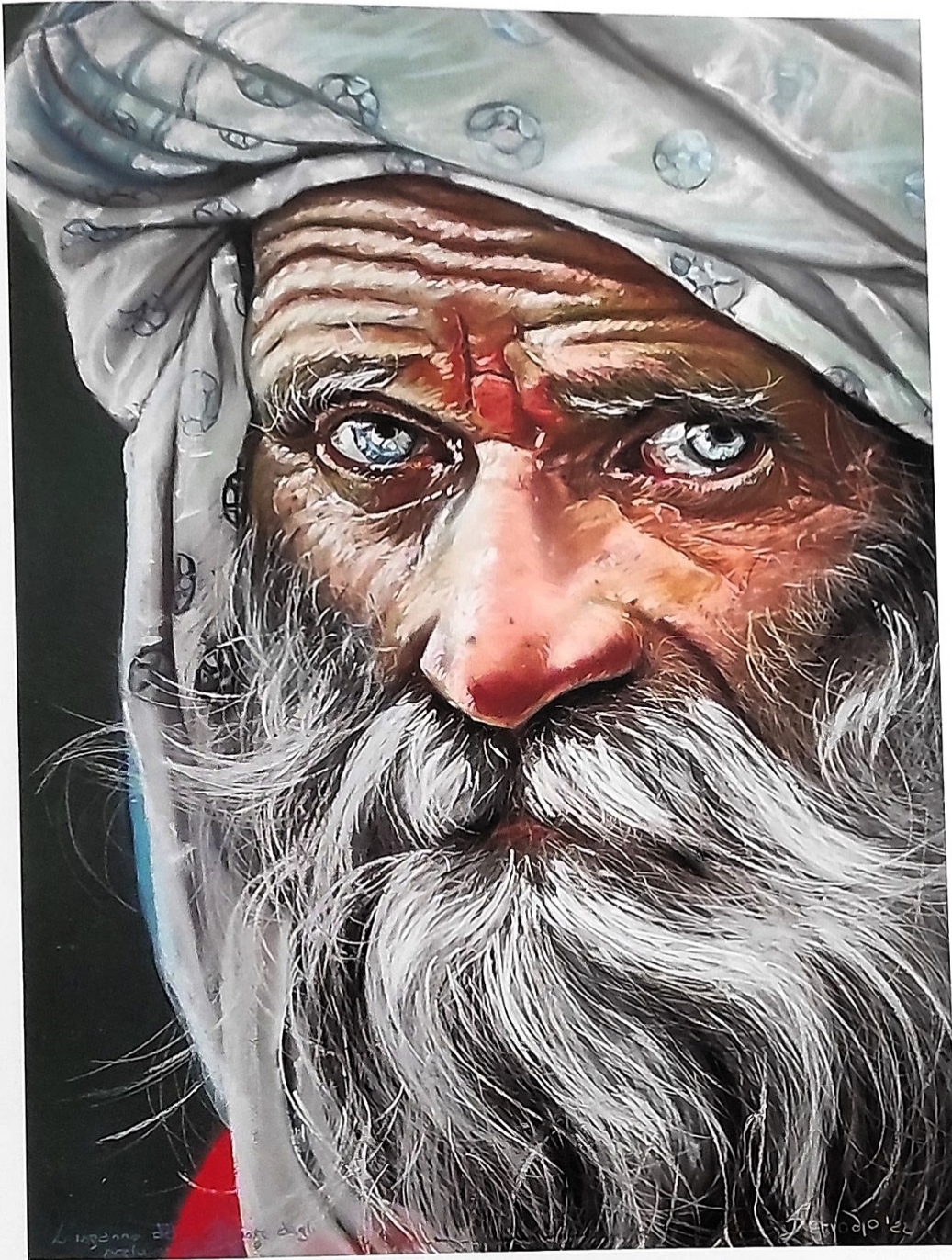
IRMA SERVODIO - L'inganno del pescatore dagli occhi d'argento , pastelli morbidi e matite su carta, cm 30x40

Il ritratto della Servodio s'inserisce a pieno titolo nel filone del figurativo iperrealista, volto alla celebrazione del più piccolo dettaglio. L'uomo si staglia davanti allo spettatore con quella piena esperienza di vita che vien fuori non solo dallo sguardo profondo e penetrante ma da ogni ruga del volto e dall'espressione consapevole e assorta.