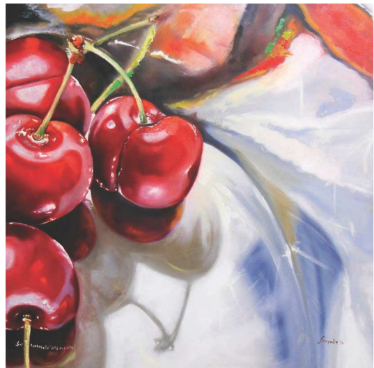
Sei la cerasella della mia vita! olio su tela, cm 50x50