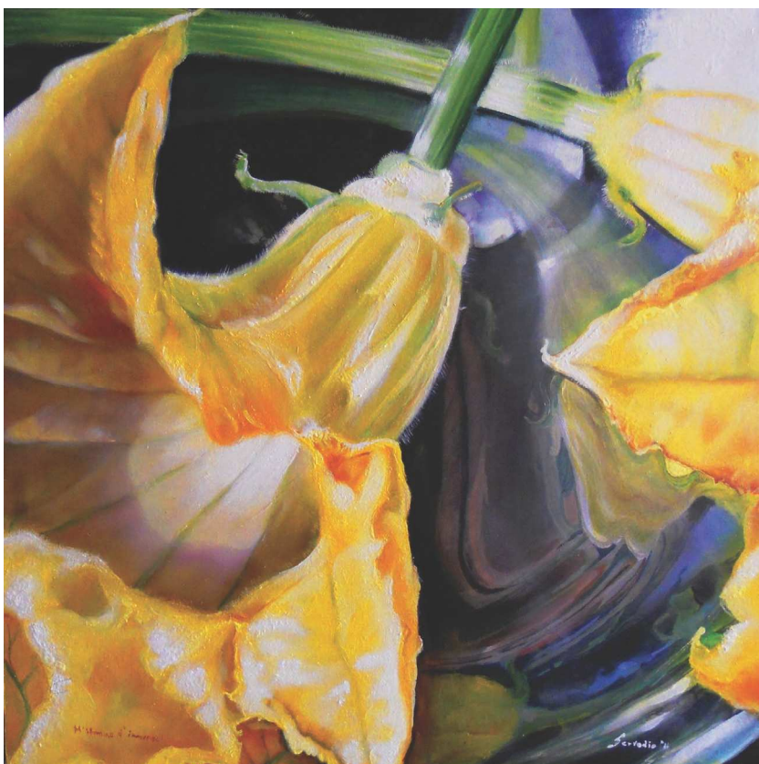
Io e te... olio su tela, cm 60x60