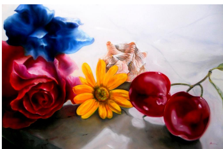
Quanti personaggi inutili ho incontrato! (Olio su tela 80x120 cm)