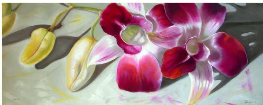
Carpe diem (Olio su tela 50x120 cm)