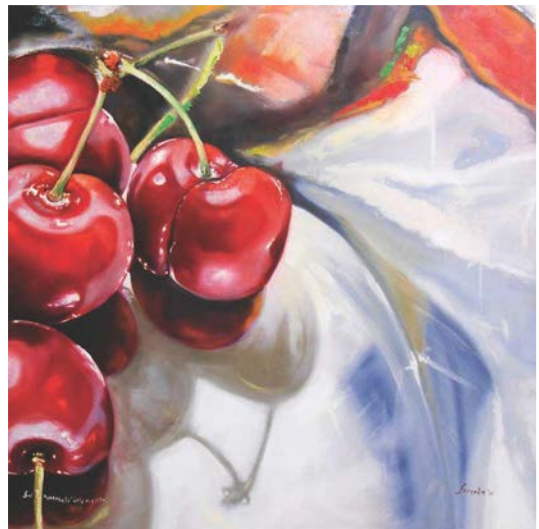
Sei la cerasella della mia vita! olio su tela, cm 50x50