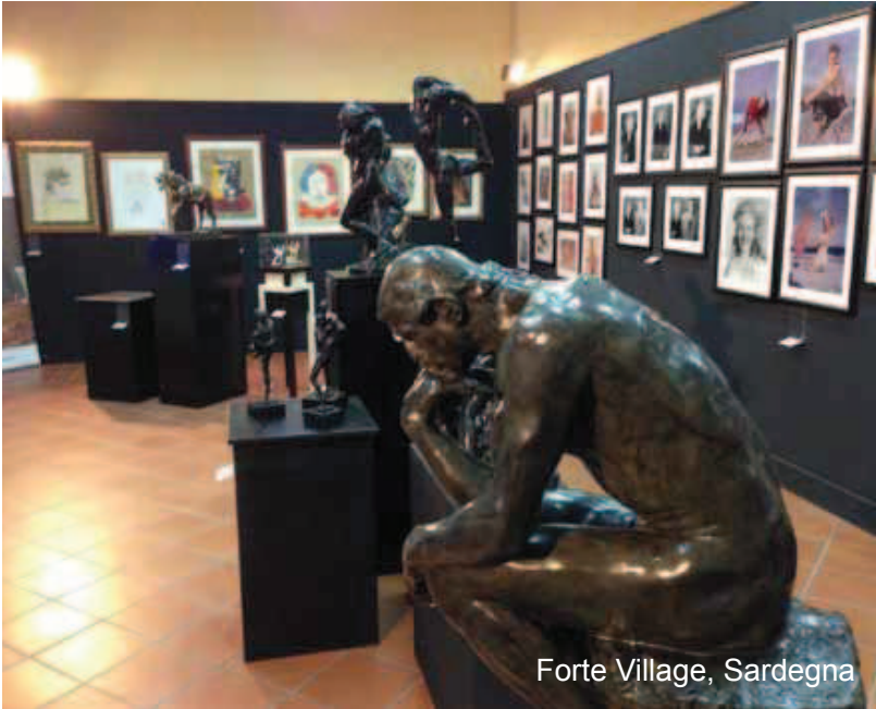
Forte Village, Sardegna