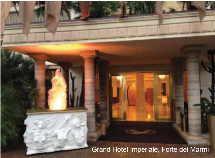
Grand Hotel Imperiale, Forte dei Marmi