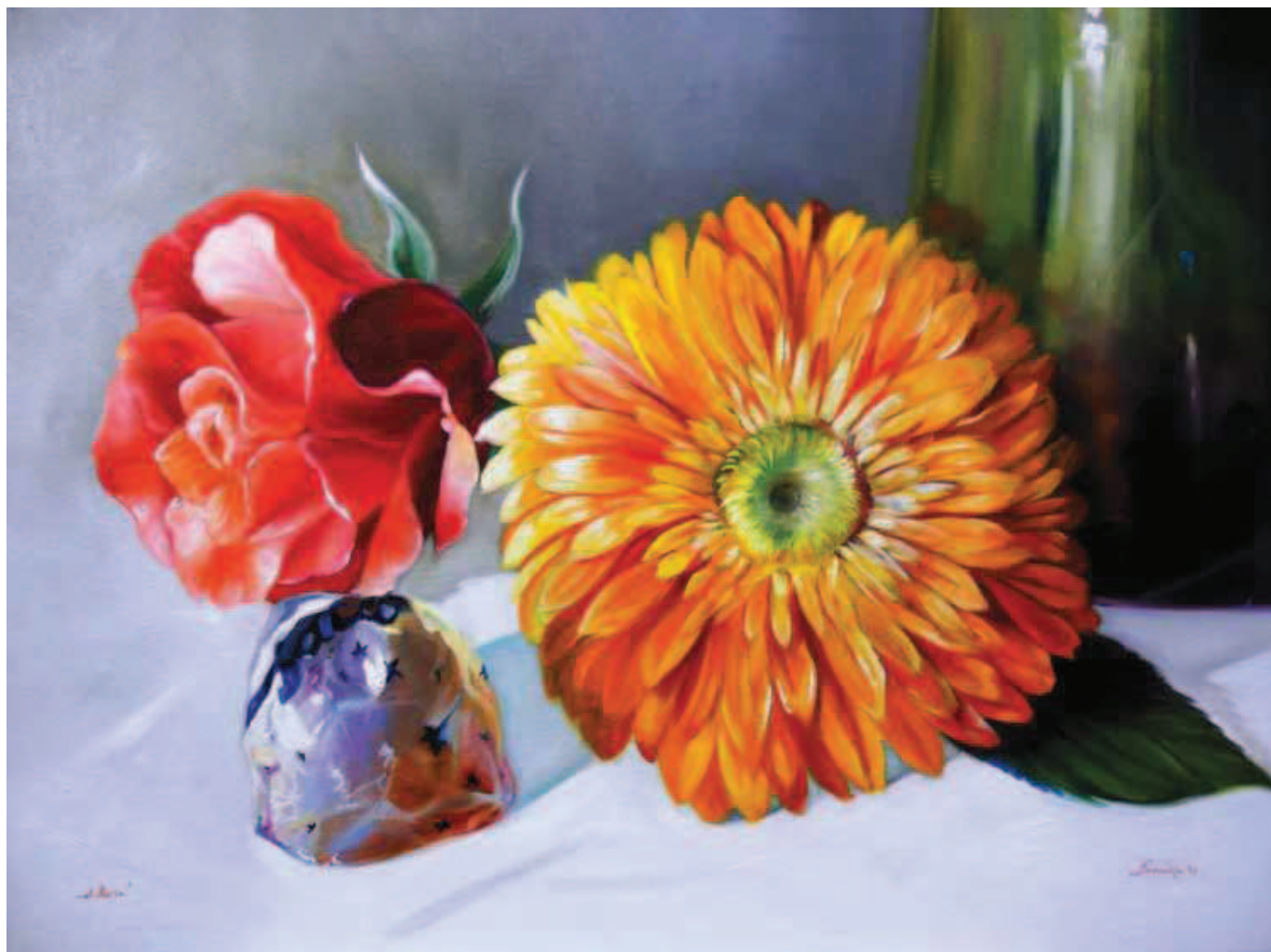
...AL BACIO! olio su tela, cm 60x80